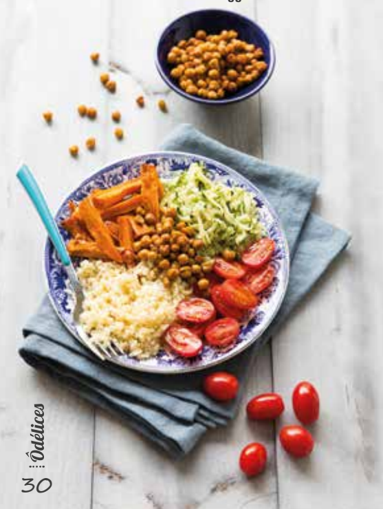
Buddha bowl veggie