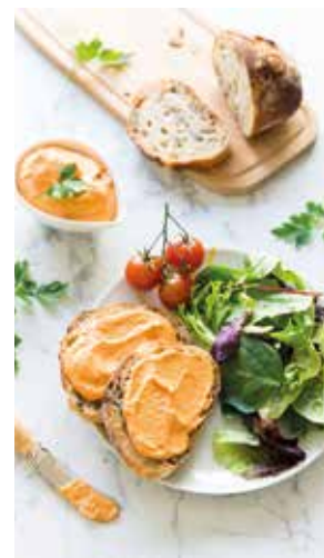
Houmous aux poivrons grillés