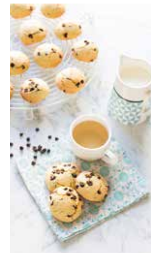
Cookies au tahin