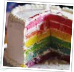
Un gâteau d'anniversaire pas comme les autres, que @xueysem a réalisé avec tout son amour.

Vous testez nos recettes ? Taguez vos posts avec @odelices ou @biodelices