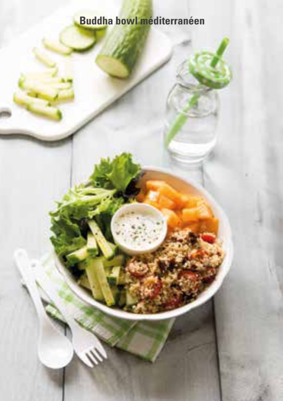
Buddha bowl méditerranéen