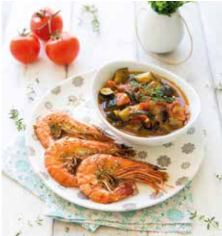
Gambas au gomasio et ratatouille

Des gambas, oui mais des Bio, sans sulfites et de belle taille ! Présentées entières, ces gambas se prêtent à toutes les préparations. Leur jolie carapace devient d'un rouge intense à la cuisson, à moins qu'on ne préfère les décortiquer pour les faire mariner.