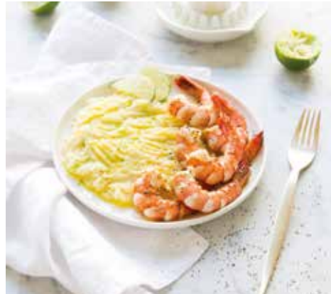
Gambas marinées au citron vert